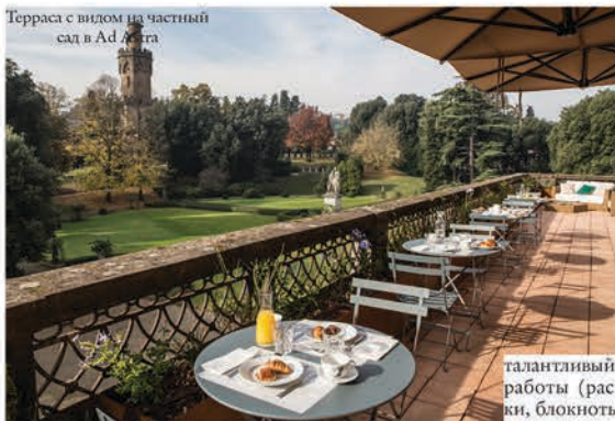
Терраса с видом на частный сад в Ad Astra