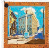
Платок, Salvatore Ferragamo