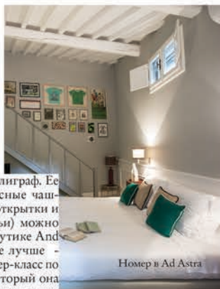
Номер в Ad Astra

талантливый каллиграф. Ее работы (расписные чашки, блокноты, открытки и даже эспандерлы) можно приобрести в бутике And Company, а еще лучше – сходить на мастер-класс по каллиграфии, который она проводит в креативном пространстве La Ménagère. В это место, объединившее в одном здании бар-бистро, ресторан, цветочный магазин и дизайн-бутик, на вечерний аперитив слетается самая яркая публика города.