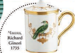
Чашка, Richard Ginori 1735