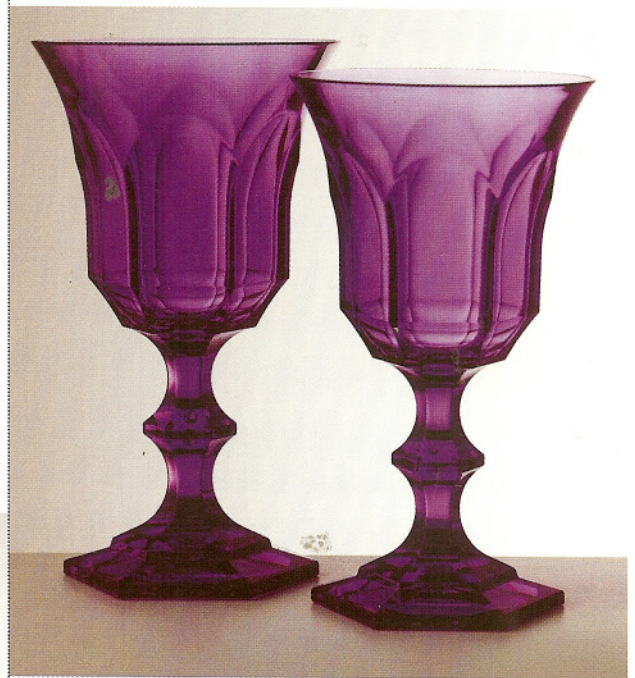
VICTORIA ET ALBERT