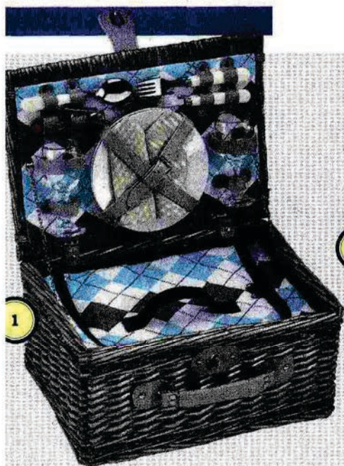
1 / CILIO

ACCESSORI DI CULTO. La tendenza detta un must: ispirarsi agli oggetti d'epoca, con un sapore vintage che si mescola al gusto raffinato dei materiali innovativi, con qualche declinazione tecnologica. Per ottenere il meglio dalle vostre gite all'aperto, consumate in spiaggia oppure nel giardino di casa, l'importante è sapere dosare sapientemente pesi, estetica, funzioni e comfort. Dalla lampada-zampirone per tenere lontane le zanzare con un tocco decisamente sofisticato, fino al set con tavolino corredato di quadri bianchi e rossi, come le tovaglie da trattoria. Non può mancare il cesto da picnic, in versione rettangolare oppure quadrata. Omaggio al passato, dentro ha il necessario per l'oggi. Senza dimenticare nemmeno i 4 zampe.