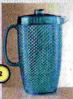
2-3-4 / MARIO LUCA GIUSTI

Cesto picnic in vimini con interno foderato, set per due persone, 71.50 €. www.cilio.de