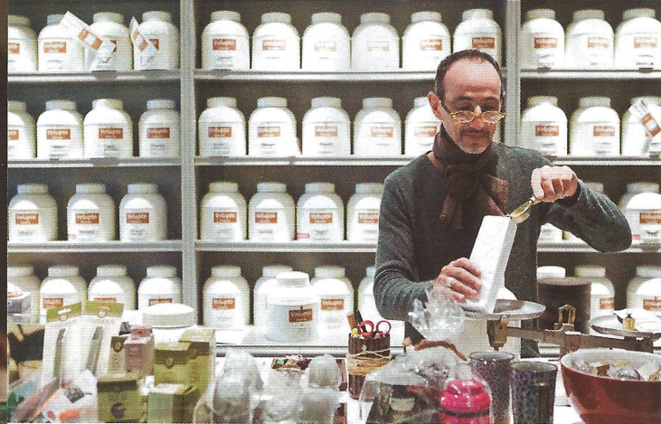
A sinistra, dall'alto: tè pregiati da Volupté ; la vetrina di Musae , concept store con pezzi di designer francesi; gioielli estrosi d'ispirazione esotica da Reminiscence .