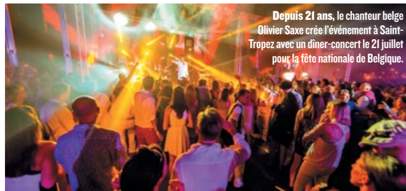
Depuis 21 ans, le chanteur belge Olivier Saxe crée l'événement à Saint-Tropez avec un dîner-concert le 21 juillet pour la fête nationale de Belgique.

thiques boîtes de nuit tropéziennes pour une nuit blanche de folie. Les night-clubbers du monde entier se donnent rendez-vous aux Caves du Roy, au Papagayo, au VIP Room ou encore à l'Esquinade, qui, depuis cinquante ans, encanaille une clientèle internationale. Peu avant les premières lueurs, on rejoint avec délices un lit accueillant, salvateur, au calme d'une villa, d'un hôtel, d'un palace ou dans l'une de ces charmantes demeures d'hôtes avec jardin et piscine comme la Villa Made (Saint-Tropez), la Bastide Bleue (Ramatuelle) ou la Villa Casabianca (Gassin)... ■ A. V.