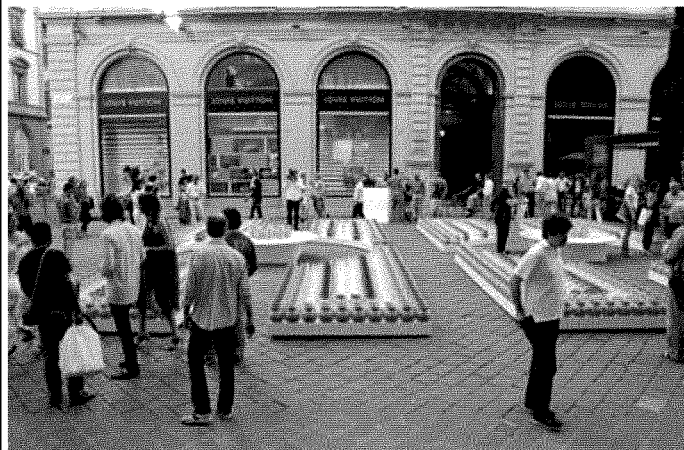
Giardino all'italiana In piazza Strozzi le caraffe di Mario Luca Giusti