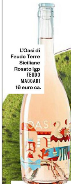
L'Oasi di Feudo Terre Siciliane Rosato Igp FEUDO MAGGARI 16 euro ca.

I colori gioiosi di porcellane e vetri, il profumo del vino e dei dolci. Che festa!