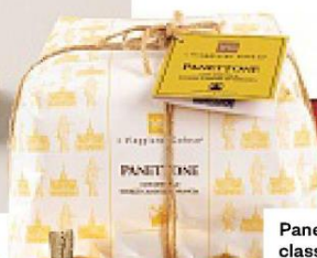
Panettone classico IL VIAGGIATOR GOLOSO.