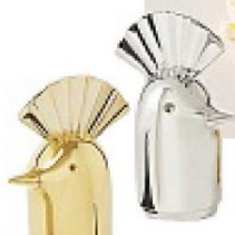
Set sale e pepe "Punki" di Jaime Hayon PAOLA C.