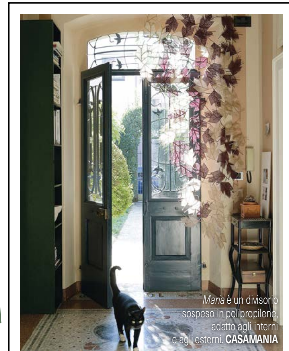
Maria è un divisorio sospeso in polipropilene, adatto agli interni e agli esterni. CASAMANIA

Il nero, colore simbolo dell'eleganza, predomina in ambienti ricercati, dove acquista fascino se abbinato a colori caldi, come il giallo e il rosa antico. Naturalmente non possono mancare il bianco e preziosi tocchi di oro!