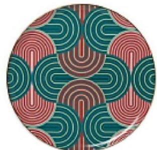
GEOMETRIE Seventies e colori a contrasto per il piatto da portata, LA DOUBLE J. euro 110.