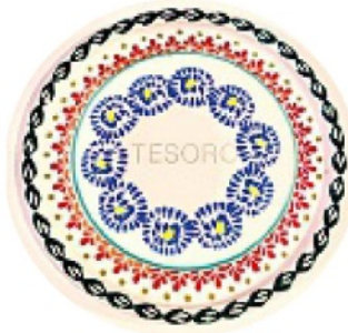
HAND MADE con tecniche tradizionali risalenti all'800, MV% CERAMICS DESIGN euro 38.