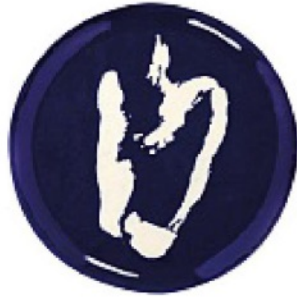
FIRMATO dall'acclamato chef israeliano Yotam Ottolenghi, in porcellana, SERAX euro 20,50.