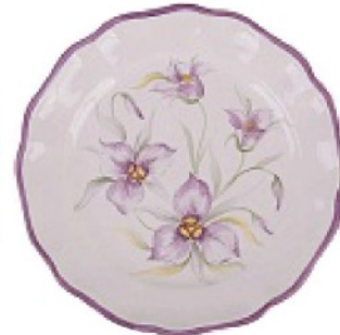
DELICATO e romantico, in ceramica dipinta a mano, VIO'S SHOP euro 50.