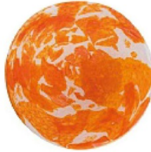
SONO uno diverso dall'altro, in vetro di Murano, STORIES OF ITALY euro 1.495 il set da 6.