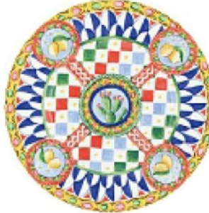
UN CARRETTO siciliano per il piatto, DOLCE&GABBANA euro 600 la coppia.