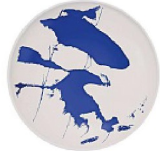
S'ISPIRA all'architetto e designer Charlotte Perriand, CASSINA euro 311,10.