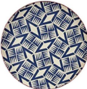
TRA MODERNO e classico, dedicato al designer David Hicks, CABANA MAGAZINE euro 60.