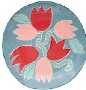
È DIPINTO a mano, in porcellana, LAETITIA ROUGET su madeindesign.it euro 160.