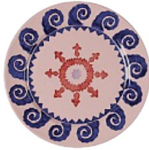
DALLA COSTIERA amalfitana, in ceramica di Vietri, EMPORIO SIRENUSE euro 110.