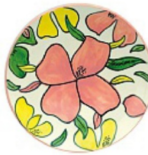
HA UN'ARIA da Anni 70, con macro fiori, POPUS EDITIONS da euro 18.