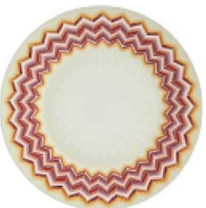
LO ZIG-ZAG più famoso arriva sul piatto in porcellana, MISSONI euro 205.