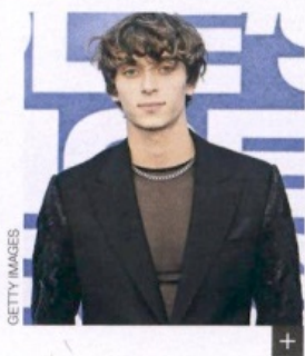
L'influencer canadese Josh Richards , 21 anni, con la "wet mop"

Ne è un esempio l'influencer Josh Richards, 26 milioni di follower solo su TikTok, che con la sua acconciatura "wet mop", ovvero "mocio bagnato" – il ciuffo parte dal centro della testa e arriva a sfiorare le sopracciglia – sta spopolando sui social. Ma anche lui non ha inventato niente di nuovo. Alessandro Magno, per esempio, portava i capelli ricci arruffati in avanti proprio come lui, seguito da Augusto e via via imitato dai futuri imperatori che speravano così di creare, grazie all'aspetto, un'associazione fra loro e i precedenti sovrani. Attraverso riccioloni e onde in avanti ottenuti con l'aiuto di