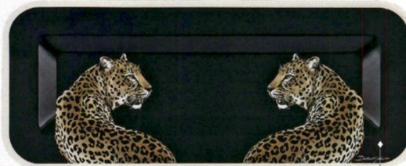
FASCINO FELINO Vassoio di legno dipinto a mano di Dolce & Gabbana (1.300 euro).