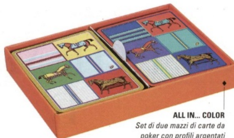
ALL IN... COLOR Set di due mazzi di carte da poker con profili argentati di Hermès (115 euro).