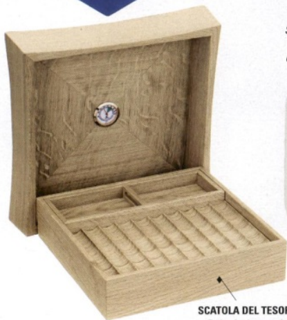
SCATOLA DEL TESORO Boite à cigares della collaborazione tra Pierre Yovanovitch e Dior (1.900 euro).