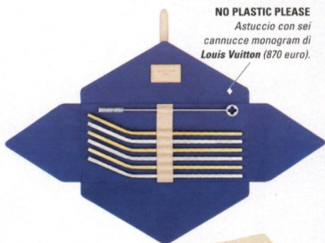
NO PLASTIC PLEASE Astuccio con sei cannucce monogram di Louis Vuitton (870 euro).