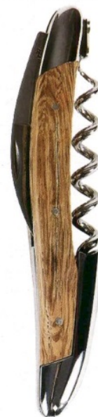
PER SOMMELIER Cavatappi Grandi Cru in rovere di Larusmiani (560 euro).