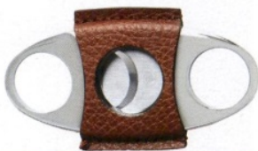
PER AFICIONADOS Custodia e taglia sigari di Brunello Cucinelli (430 e 250 euro).