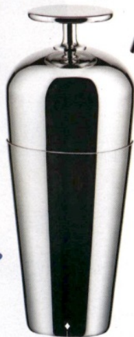
COCKTAIL DESIGN Shaker e Jigger The Tending Box di Alessi (179 euro).