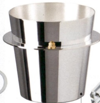
MEDUSA ROCKS Secchiello per il ghiaccio di Rosenthal Versace (425 euro).