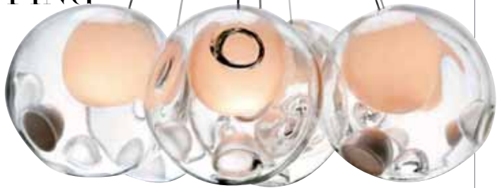
Lámpara 28-7, BOCCI , US $3,430 mattermatters.com