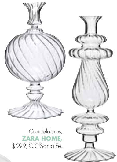
Candelabros, ZARA HOME , $599, C.C Santa Fe.