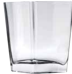
Florero, LEONARDO , El Palacio de Hierro.*