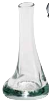
Floreros, BETTINA SCHORI , schori.dk *