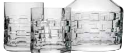
Vasos y licorera, HERMÉS , Masaryk 422, Polanco.*