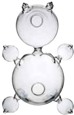
Florero Duchess Double Happiness , DFCASA , $9,187, Common People .