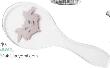
Espejo, BY:AMT , US $640, buyamt.com .