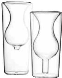
Copas colección InsideOut , BY:AMT , US $48, buyamt.com