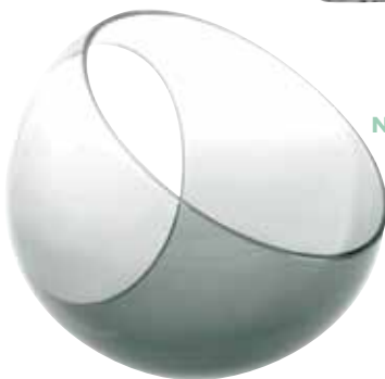
Canasta de Emiliano Godoy, NOUVEL STUDIO , nouvelstudio.com *