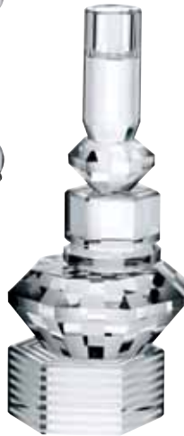
Candelabro Valencia de Jaime Hayon, GAIA & GINO , US $200, momastore.org