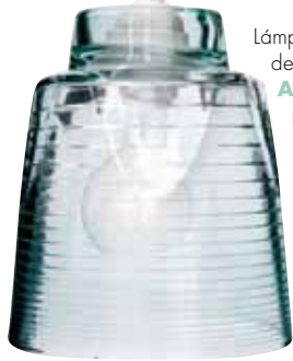
Lámpara In The Right Lamp de Rich, Brilliant, Willing, ARTECNICA , US $95 richbrilliantwilling.com