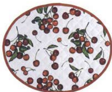
AMERICANO ART. 21808010 € 19,00