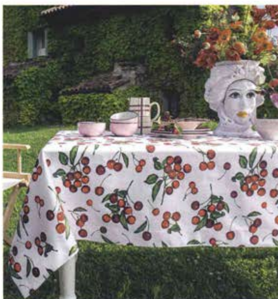
TOVAGLIA RETTANGOLARE DA 6 ART. 21808005 € 50,00