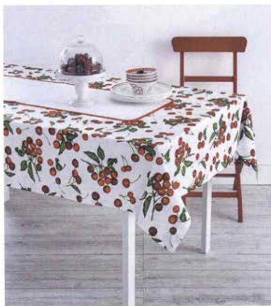
TOVAGLIA DA 6 CON AIDA DA RICAMARE ART. 21808002 € 59,00