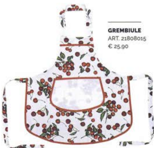
GREMBIULE ART. 21808015 € 25,90