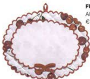
FUORIPORTA ART. 21808001 € 18,00

Protagoniste sul tessuto in cotone di estate faranno la cucina più briosa e più gustosa.