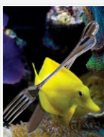
produção Marca d'Água, Máxima Interiores, desenho meu / Water Mark editorial, Máxima Interiores, styled by me