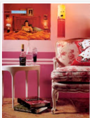
produção As Flores Todas, LuxDeco, foto de Paulo Lima, meu desenho / All the Flowers editorial, picture by Paulo Lima, styled by me