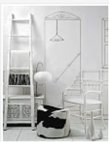
produção Preto no Branco, Máxima Interiores, foto de Paulo Lima, meu desenho / Black n' White editorial, Máxima Interiores, picture by Paulo Lima, styled by me