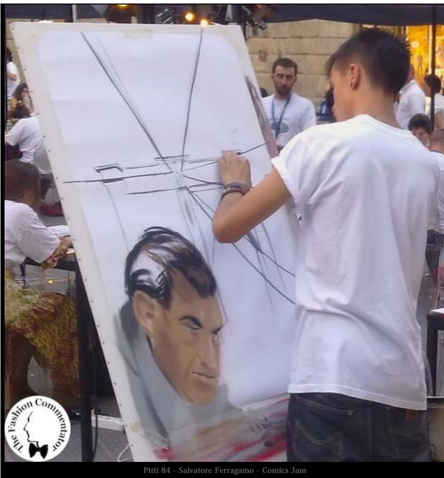
Pitti 84 - Salvatore Ferragamo - Comics Jam