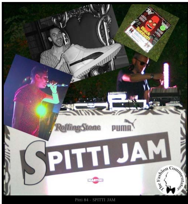
Pitti 84 - SPITTI JAM

Puma in collaborazione con il magazine Rolling Stone Italia ha presentato nello splendido Palazzo Pandolfini una preview della SS2014 collection con l'evento "SPITTI JAM: il Rap incontra la Moda". Maestro di cerimonia il rapper MARRACASH che con la sua performance live ha movimentato l'atmosfera creando un netto contrasto con gli ambienti incorniciati da specchi, statue e stucchi.