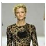
Il saldo intelligente