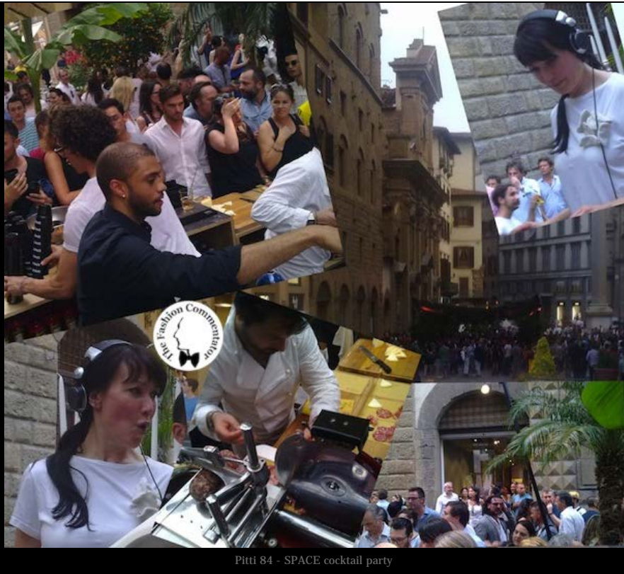
Pitti 84 - SPACE cocktail party

Another shop, another party: a forest of palm trees and a beach kiosk in via Sassetti (opposite the Odeon cinema) indicated the opening of the new Gerard store . Gerard is a Florentine brand specialized in casual wear that has finally found its fixed place after the closure of many shops that filled the center. Inside the store there were collections in full summer mood with floral prints all over, while outside, the crowd was intent on sipping beer... ça va sans dire!