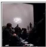
Elena Mirò FOR.ME Spring Summer 2013 fashion show