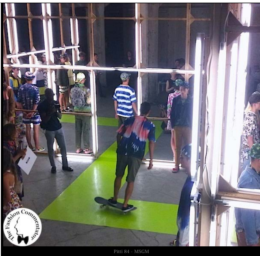
Pitti 84 - MSGM