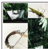
Ever Bamboo Gucci Bag by Laura Popoviciu