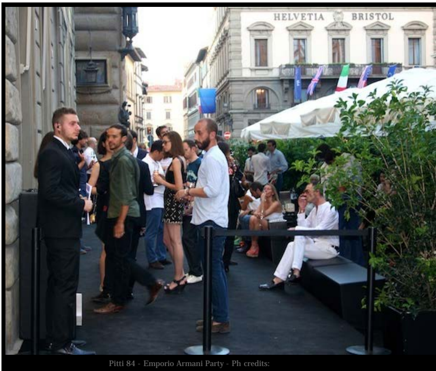
Pitti 84 - Emporio Armani Party - Ph credits:

To get to the Aquazzura shoes presentation at Palazzo Corsini, I passed through Piazza Santa Trinita, where Salvatore Ferragamo in collaboration with Lucca Comix , organized the Comics Jam , a contest for young cartoonists. The challenge was to create a cartoon of 8 pages in 8 hours, inspired to the world of shoes as the exhibition "The prodigious shoemaker", opened in April at the Museo Salvatore Ferragamo. Pencils, pantone, tempera, ipad, computer, graphic tables and a crowd of young talents, under the supervision of experts cartoonists, have transformed the most fashionable street of Florence in a real studio.