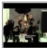
ABOUT FACE - Dietro il volto di una modella by Timothy ...