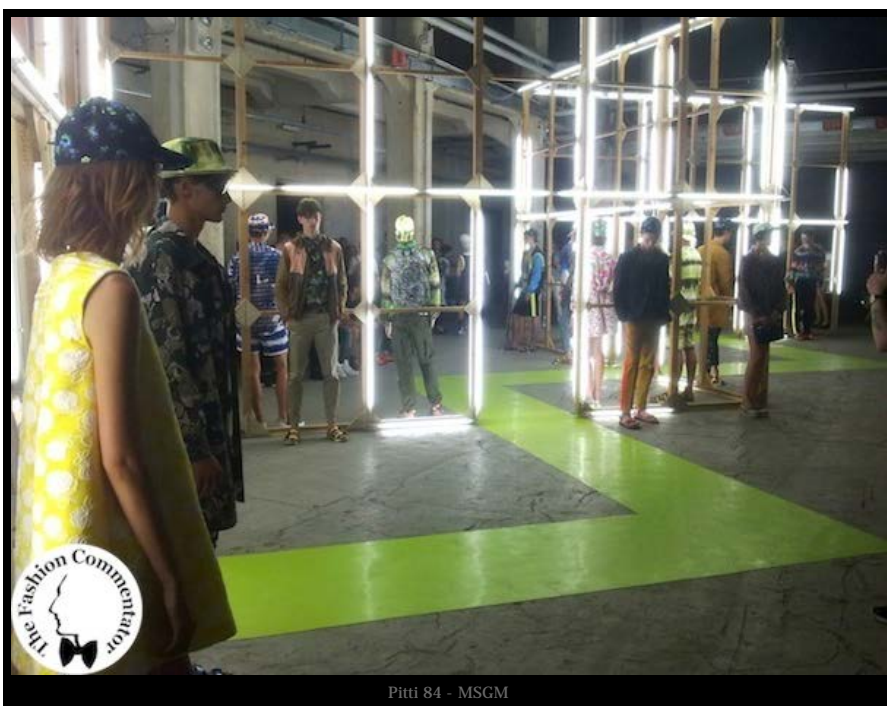
Pitti 84 - MSGM

In Piazza Strozzi, Emporio Armani boutique hosted an intimate cocktail with DJ set, during which you could appreciate the new collection, relaxing in a quiet, almost ethereal atmosphere, outside of the typical Pitti chaos.