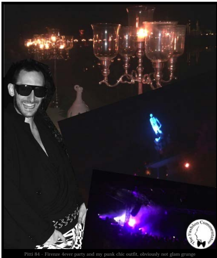
Pitti 84 - Firenze 4ever party and my punk chic outfit, obviously not glam grunge

Impossibile non iniziare con il chiacchieratissimo e pubblicizzatissimo (tutto -issimo) LuisaViaRoma Firenze4Ever blogger party del 17 sera ambientato nella splendida cornice del Giardino di Boboli. L'atmosfera era particolare e ricca di contrasti: la grandissima tavolata ellissoidale che correva lungo i bordi della "fontana dell'Oceano" del Giambologna illuminata da candelabri d'argento e decorata con ghirlande di fiori trasportava gli ospiti in una dimensione onirica; mentre oltre le siepi secolari, con il palco per il concertone rock, gli open bar dai drink fumanti e le vip blogger che zampettavano su tacchi vertiginosi sembrava di essere ad una versione ridotta del Coachella in salsa italiana. L'unica vera pecca della serata, l'assenza di luce, ma in fin dei conti è stata anche una fortuna, permettendoci di oscurare gli orrori dovuti all'ossimorico dress code glam grunge.